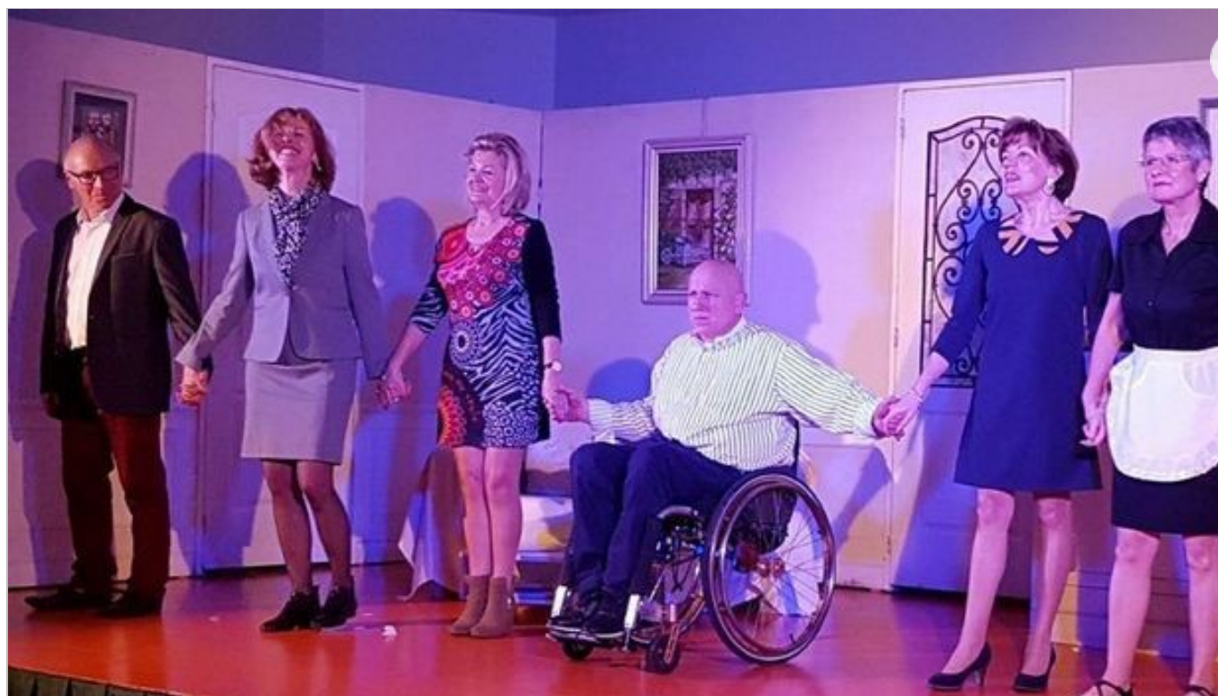
La compagnie «Les Ephémères» sur scène